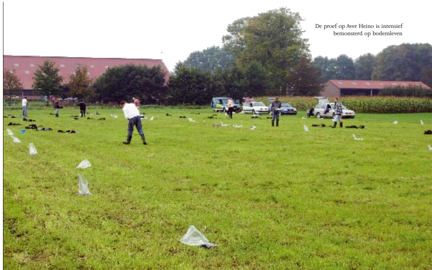
De proef op Aver Heino is intensief bemonsterd op bodemleven

Is de afvoer van mest van invloed op de bodemkwaliteit van een melkveebedrijf?